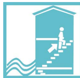
Montez dans les étages