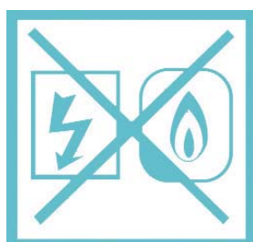
Coupez l'électricité et le gaz