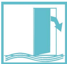
Fermez la porte, les aérations